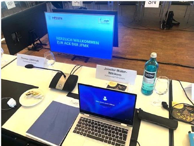
Startschuss für die erste ACK der JFMK

staltung sozialer Medien und Stärkung der Medienkompetenz gesetzt. Dazu liegt seit dem 20. April 2026 die Bestandsaufnahme der Expertenkommission des Bundes vor.