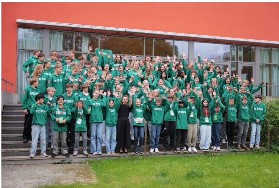
Unser Team in der Bremer Landesvertretung in Berlin

Basketball: U18-Jungen, 14. Platz; Geräturnen: U16-Mädchen, 15. Platz; Handball, U14-Jungen, 10. Platz; U14-Mädchen, 7. Platz; U16-Jungen, 14. Platz; U16-Mädchen, 7. Platz; Volleyball: U-16-Jungen, 10. Platz; U16-Mädchen, 12. Platz; U18-Jungen, 15. Platz; U18-Mädchen, 4. Platz