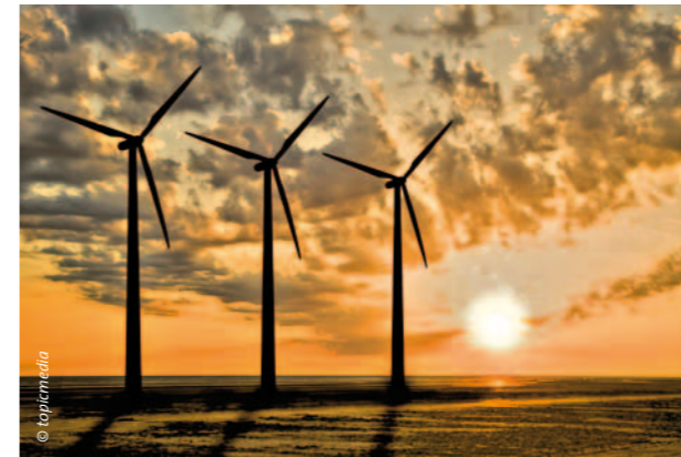
Moderne Kunststoffe – Produkte der Chemie – sind leicht und geben den Rotoren Stabilität.