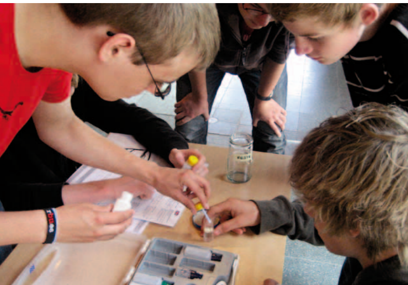
In der Ausstellung werden Schüler neugierig auf chemische Experimente und Verfahren gemacht.