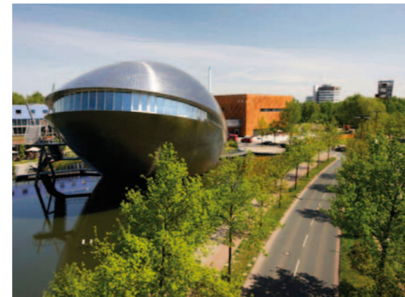
Das Gebäude des Universum® Bremen erinnert an einen Wal oder eine Muschel. Die Wanderausstellung ist in der rostrotten SchauBox zu sehen.

Die Ausstellung eignet sich als Ergänzung und Vertiefung des naturwissenschaftlichen Unterrichts. Auch für die Fächer Wirtschaft, Geografie, Politik und Werte und Normen bietet die Ausstellung Bezugspunkte. Sie eignet sich für Schulklassen ab Klasse 7. Für das passende pädagogische Begleitprogramm ist eine Anmeldung erforderlich.