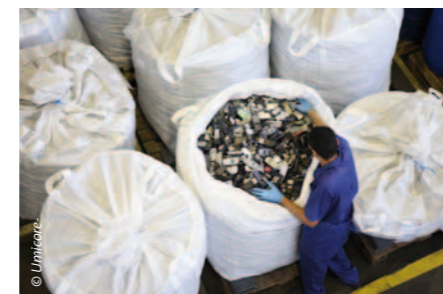
Handys enthalten wertvolle Rohstoffe. Bringen Sie Ihr altes mit!

Das Konzept der Nachhaltigen Chemie berücksichtigt auch gesellschaftliche Aspekte. Es trägt dazu bei, die mittlerweile sieben Milliarden Menschen auf der Welt mit Trinkwasser, Nahrung, Energie und Arzneimitteln zu versorgen.